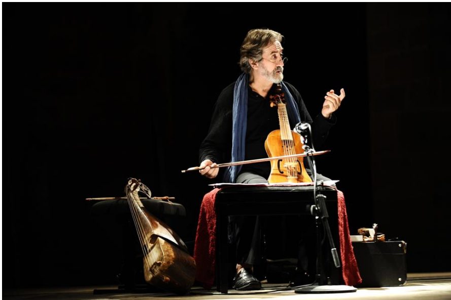
Jordi Savall